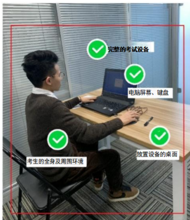
图四：佐证视频监控视角

(4) 电脑端和移动端摄像头全程开启拍摄考试过程。移动端拍摄的视频通过“智考通”上传，请耐心等待全部视频上传完成，如提示上传失败，请选择重新上传，请考生务必确认佐证视频全部上传成功。如出现视频拍摄角度不符合要求、无故中断视频录制等情况，都将影响成绩的有效性，由考生本人承担所有责任。