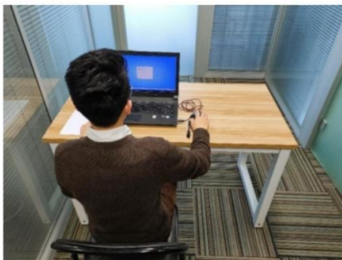
图二：电脑端背面视角