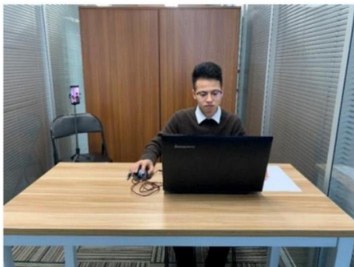
图一：电脑端正面视角

(3)考试开始前，考生需要先登录移动端“智考通”，用前置摄像头360度环绕拍摄考试环境，随后将移动设备固定在能够拍摄到考生桌面、考生电脑桌面、周围环境及考生行为的位置上继续拍摄(详见说明书中《智考通操作手册》《智考云在线考试规范》)。